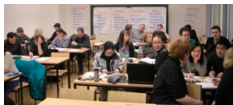
Lernatmosphäre in Wuppertal mit deutschen Studierenden und chinesischen Austauschstudenten 大学内，中德大学生共同学习的场景

Im Rahmen von derzeit 11 formalisierten Hochschulpartnerschaften und einer Vielzahl von Einzelprojekten, u.a. mit der Peking University, der Huazhong University of Science & Technology und der Wuhan University, pflegt die Bergische Universität enge Lehr- und Forschungsk Kooperationen mit der Volksrepublik China.