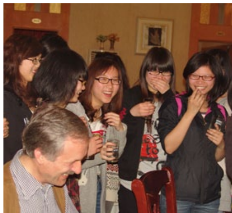
Abschlussparty der Summer School mit Teilnehmern und Dozenten 暑期学校结业庆典上的教师和学员们

值得一提的是，我校是，中国-北威州大学联盟 China-NRW University Alliance “的成员之一，该联盟由北威州六所最优秀的高校组成，其目的在于共同努力，继续增进与中国的友好关系。该联盟为中德两国的合作方提供了一个很好的交流平台，并为进行互惠互利的合作活动提供有利的支持。