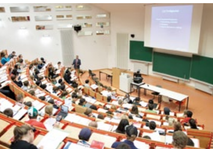
Hörsaal der Bergischen Universität 大学阶梯教室

Die Bergische Universität ist eine moderne und eigenständige Universität mit sehr guter nationaler wie internationaler Reputation. Die Forschungs- und Lehrstruktur gliedert sich in sieben Fachbereiche: Geistes- und Kulturwissenschaften; Wirtschaftswissenschaft; Mathematik und Naturwissenschaften; Architektur, Bauingenieurwesen, Maschinenbau, Sicherheitstechnik; Elektro-, Informations- und Medientechnik; Design und Kunst; Bildungs- und Sozialwissenschaften sowie die School of Education, 11 interdisziplinäre Forschungszentren und 15 Institute. Derzeit zählt die Universität etwa 250 Professorinnen und Professoren, 3.130 Mitarbeiterinnen und Mitarbeiter sowie 16.700 Studierende. Mehr als 2.000 internationale Studierende aus über 100 Ländern profitieren von der hohen Qualität der vielfältigen und praxisorientierten Studien- und Betreuungsangebote. Mit einer Zahl von aktuell 329 bilden Studierende aus der Volksrepublik China die größte nationale Gruppe. Ihre Studienschwerpunkte liegen vor allem im Bereich der Ingenieur- und Wirtschaftswissenschaften.